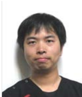
火・水・木曜日 折田